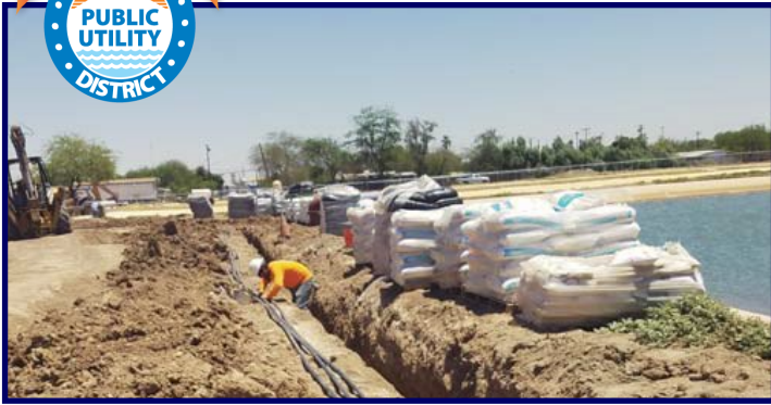
HPUD WATER PLANT IMPROVEMENT PROJECT

(760) 353-0457 - on call emergency after hours